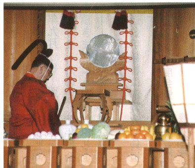
終戦六十年臨時大祭並に秋季例祭にて 天皇陛下よりの幣帛料を神前にお供えする宮司